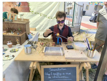
Le métier de souffleur de verre a captivé beaucoup de jeunes.